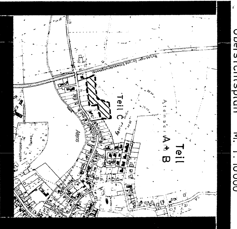
Übersichtsanlage M. 1:10000